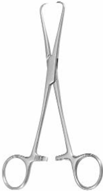
cm BERNHARD 16,5 BE2410.16 18 BE2410.18