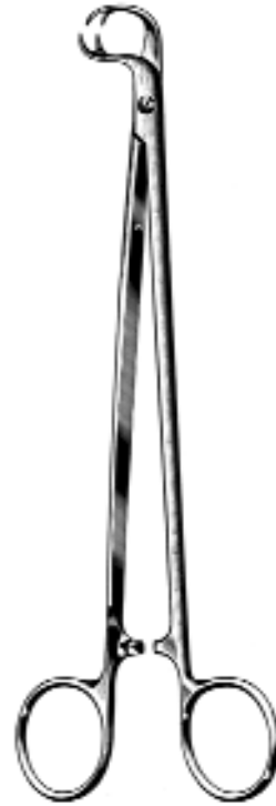
cm MOYNIHAN 19 BE2510.19