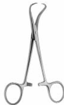
cm BACKHAUS KOCHER 13 BE2113.13