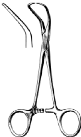
cm BACKHAUS 9 BE2111.09 11 BE2111.11 13 BE2111.13 15 BE2111.15

with tube holder mit Schlauchhalter avec clamp porte-tube con porta-tubo con porta tubo