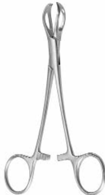
cm LANE 13,0 BE2614.13 15,0 BE2614.15 20,0 BE2614.20