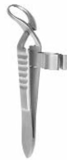
cm JONES-CLIP 9 BE2015.09

with tube holder mit Schlauchhalter avec clamp porte-tube con porta-tubo con porta tubo